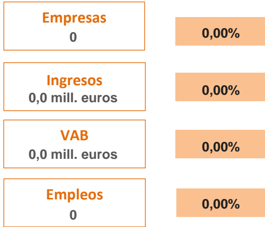
Evolución del VAB y de los Ingresos Agregado, mill. euros (2020-2022)