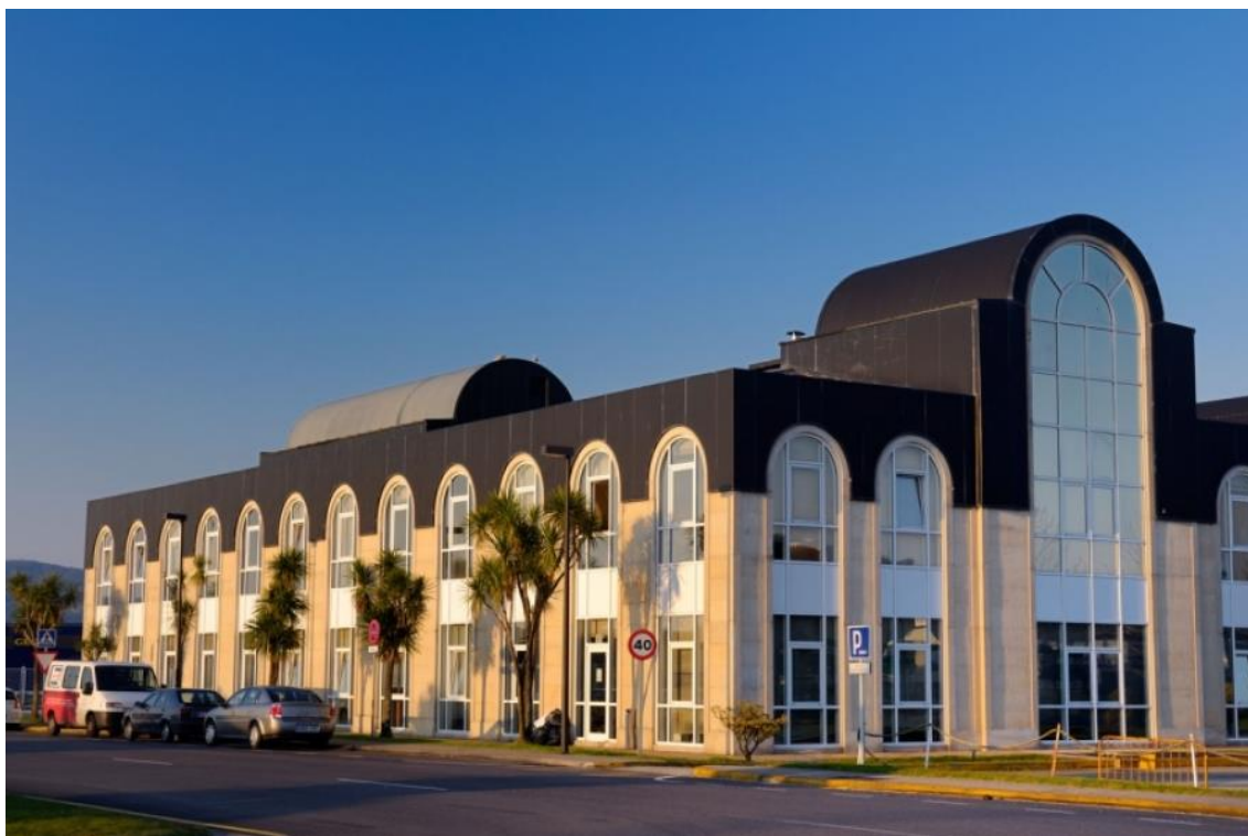
Edificio de oficinas del Consorcio

Los aspirantes deberán identificarse presentando su DNI.